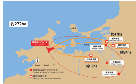
■九州大学のキャンパス計画マップ

都市の近郊という利便性を持ちながら、玄界灘に望む豊かな自然が残された静謐な環境にあります。また、ここは、古くから朝鮮半島などからの往来が盛んであったことを示す遺跡が数多く存在する歴史